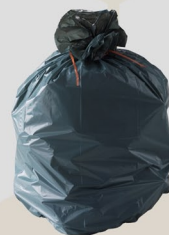
AUTRES DÉCHETS NON RECYCLABLES ...