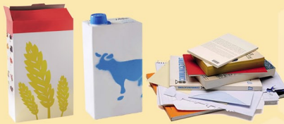
CARTONS - BRIQUES - PAPIERS ALIMENTAIRES