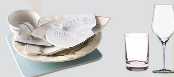
VAISSELLE EN VERRE OU PORCELAINE